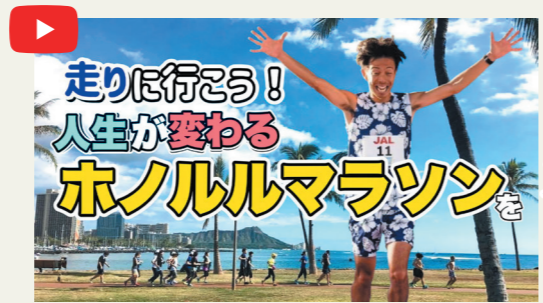
「走りに行こう！人生が変わるホノルルマラソンを」 https://youtu.be/2raYc_kWTFM